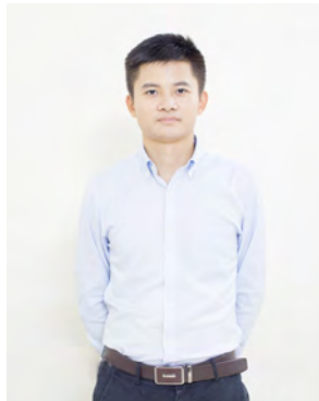
莫奔:毕业于上海交通大学 (2012年入职信步)