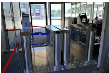
金砖国家厦门峰会人脸识别安保系统