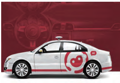
“机器人驾培教练”智能车载终端