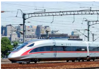
“复兴号” WiFi覆盖解决方案