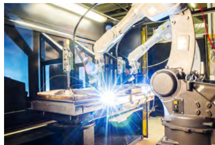
博世/海力士/通用/富士康自动化生产设备