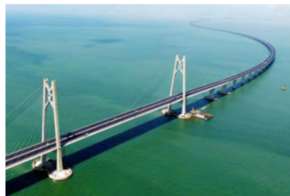
港珠澳大桥自助售票终端