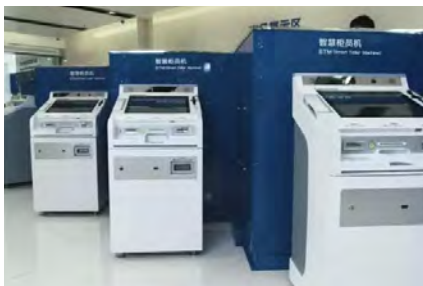
建设银行智慧柜员机STM