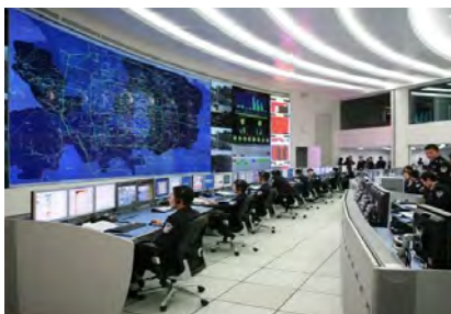
平安城市立体安防+执法监控中心