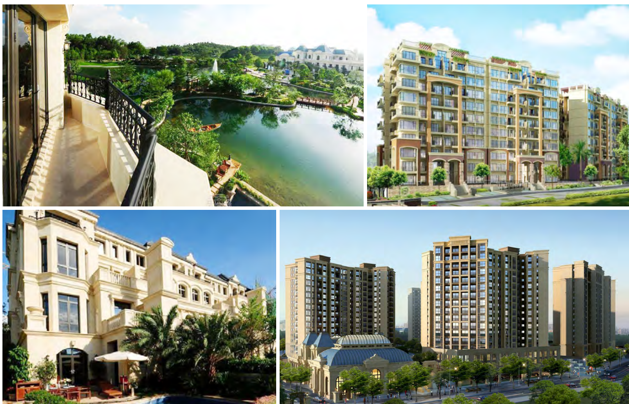
信步员工生活基地