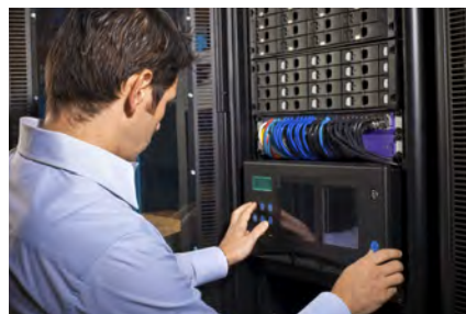
企业级网络安全设备UTM